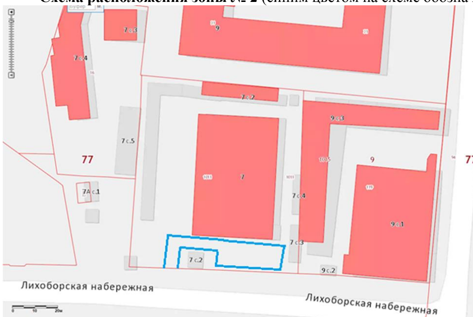
Схема расположения зоны № 2 (синим цветом на схеме обозначены границы зоны):

Для зоны № 2 - под территорией Исполнителя стороны понимают земельный участок с кадастровым номером 77:09:0001015:1011, адрес объекта: г. Москва, Лихоборская наб., вл. 7, принадлежащий Исполнителю на праве аренды по договору № М-09-036408 от 09.12.2011.